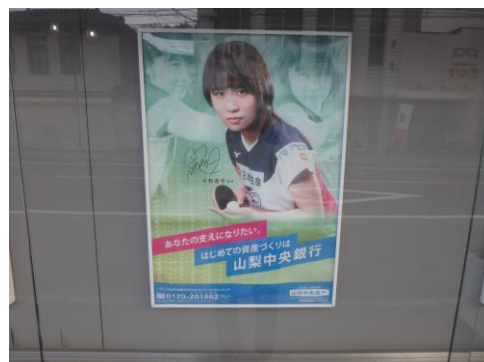
卓球の平野美宇選手。山梨県出身。 山梨中央銀行がバックアップ。