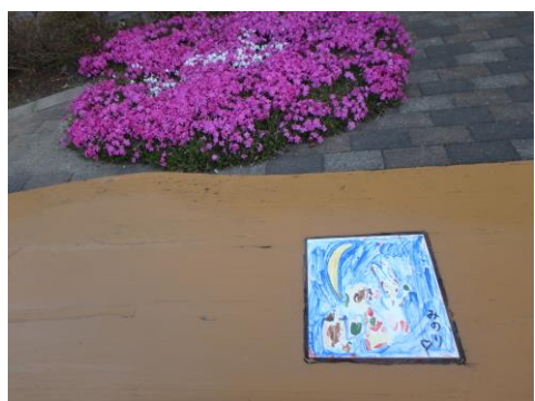
街中の木のベンチ。小学生の絵のタイ ルが埋め込まれている。あったかい。