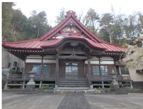
無辺寺。掲示板に“過去と相手は変えられないが、未来と自分は変えられる”