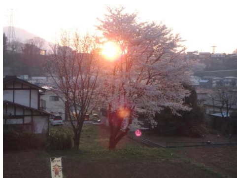
自宅近く。桜の木から日が昇る。 今日も平和であります様に。