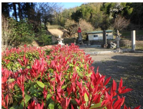
地元浅利与一地蔵のそばに、 燃えるような葉っぱ。緑と赤の芸術。