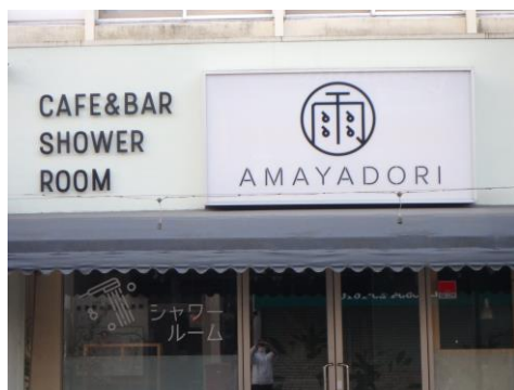
街中メイン通りの喫茶店雨宿り。ハイキ ング客様にシャワーサービス有。親切。