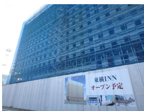
駅の向こうに14階東横インが今年中にできる。山梨最大の506室。大月も大きく発展するだろう。