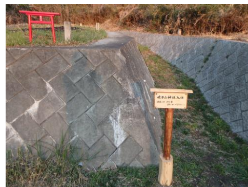
自宅から300m。誰が建てた姥子山 神社入口立て看板と小さな鳥居。合掌。