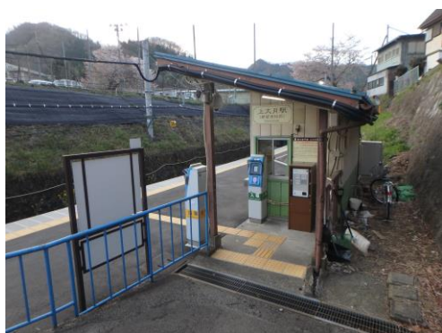
大月駅からすぐの上大月駅。無人ローカル駅なのに立看板がおしゃれ！