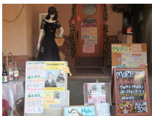
駅近くのピザハウス&美容院。マネキンちゃんがちょっと不気味。