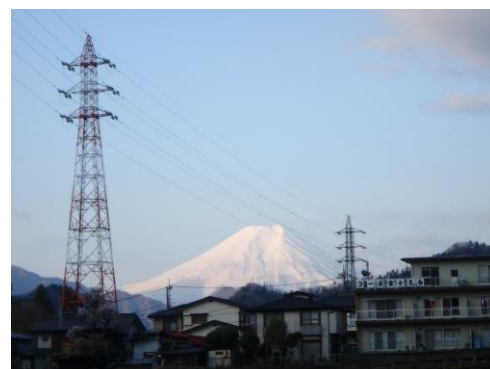
今日も富士が美しい。どうか早くコロナが収束します様に。