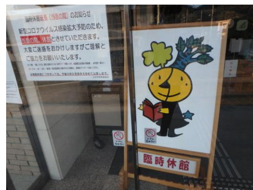
大月図書館。いつまで休館になるのだろう。早く小生の本の展示具合を見たい。